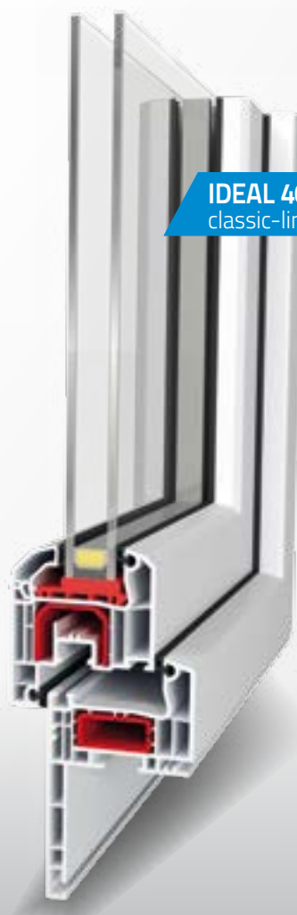
IDEAL 4000® classic-line

Avec ce type de pose, on évite le danger d'endommager les murs de l'immeuble, on gagne du temps et les travaux de finition ne sont pas nécessaires.